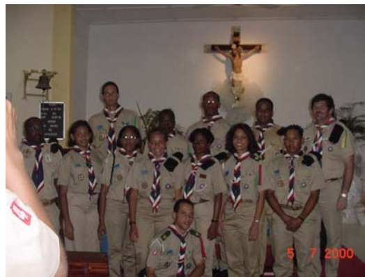
Delegashon ku a bai World Moot na aña 2000.

Punto di kontakto pa Scout Shop Direkshon pa pòst: P.O. Box 4356, Kòrsou, Antia Hulandes Email: scoutshop@onenet.an Wepsait: scoutshopsa.org Telefon: +59997388322 Banko: Giro: 525858 RBTT: 102.37.65