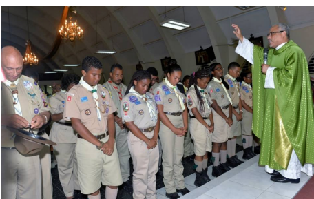
Delegashon World Jamboree Japon