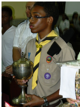
Misa di Hubentut 31-01-2015