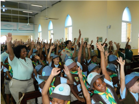
Apertura di aña 10-01-2015