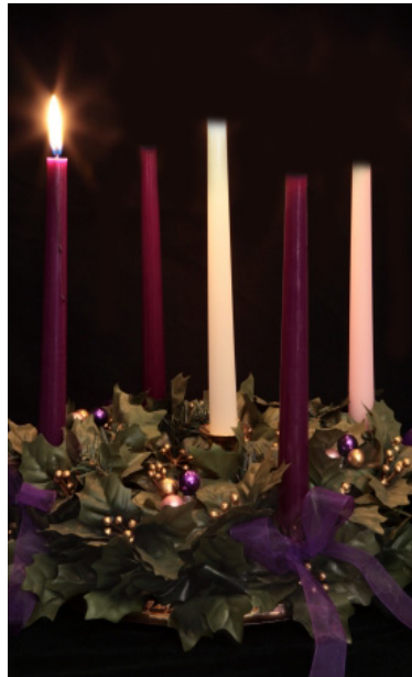
Reflection is adapted from St. Anthony Messenger Press. www.AmericanCatholic.org

Na kuminsamentu di Atvènt di e aña aki, e yamada di apòstel san Pablo na e kristiannan di Roma ta pa nos tambe un Palabra di Dios hopi aktual i urgente pa nos aktua segun e Spiritu di bèrdat ku ta iluminá nos bida i nos historia. E ehèmpel i e komparashon tokante lus i skuridat ta un tema hopi konosí i sugestivo den Beibel, i den temporada di Pasku di Nasementu ta e signo mas usá pa liturgia i tradishon kristian, (nos mester bisa tambe esun mas komersialisá pa nos mundu). Mi ta referí, por ehèmpel, na e signo di e korona di Atvènt ku e kuater bela ku ta sende un tras di otro riba kada djadumingu di Atvènt. Nos ta mensioná e pesebre ku danki na e